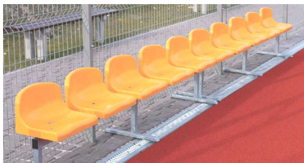
Widok przykładowych systemowych siedzisk

Kolory siedziska z gamy kolorów: zielony, niebieski, czerwony, żółty do wyboru przez Inwestora. Konstrukcja wykonana ze stalowego, cynkowanego profilu. Belka siedziska wykonana z profilu 60x40. Rozstaw siedzisk: 500 mm. Konstrukcja wersji wolnostojącej. Długość konstrukcji dostosowana w zależności od wymaganej liczby miejsc.